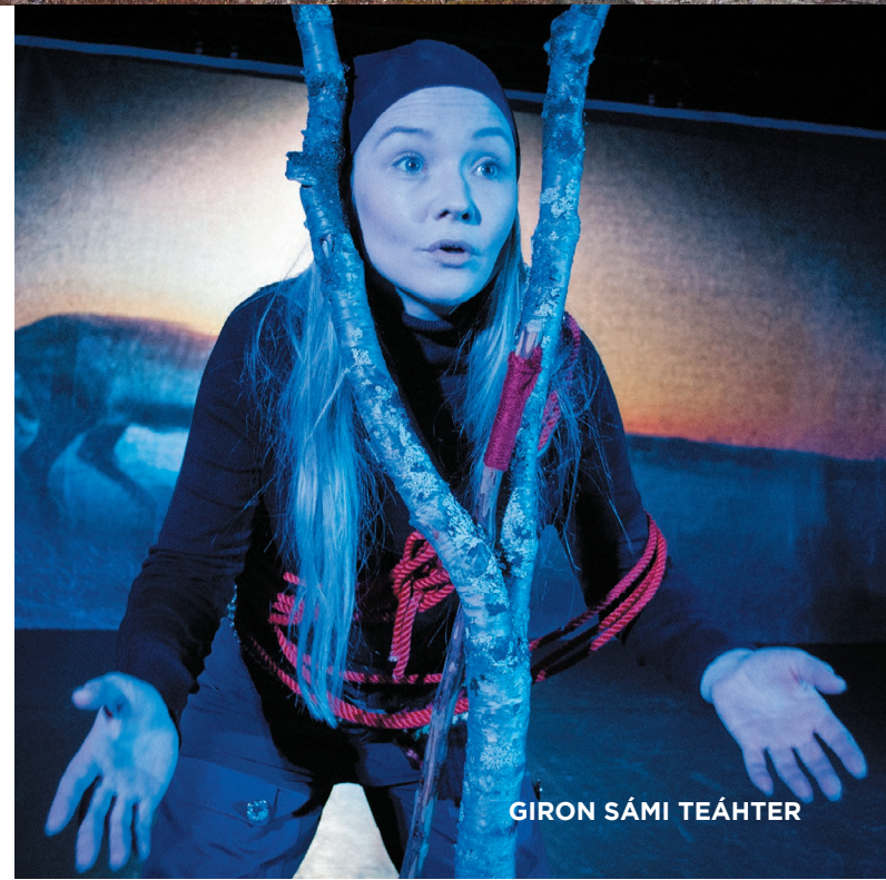
GIRON SÁMI TEÁHTER